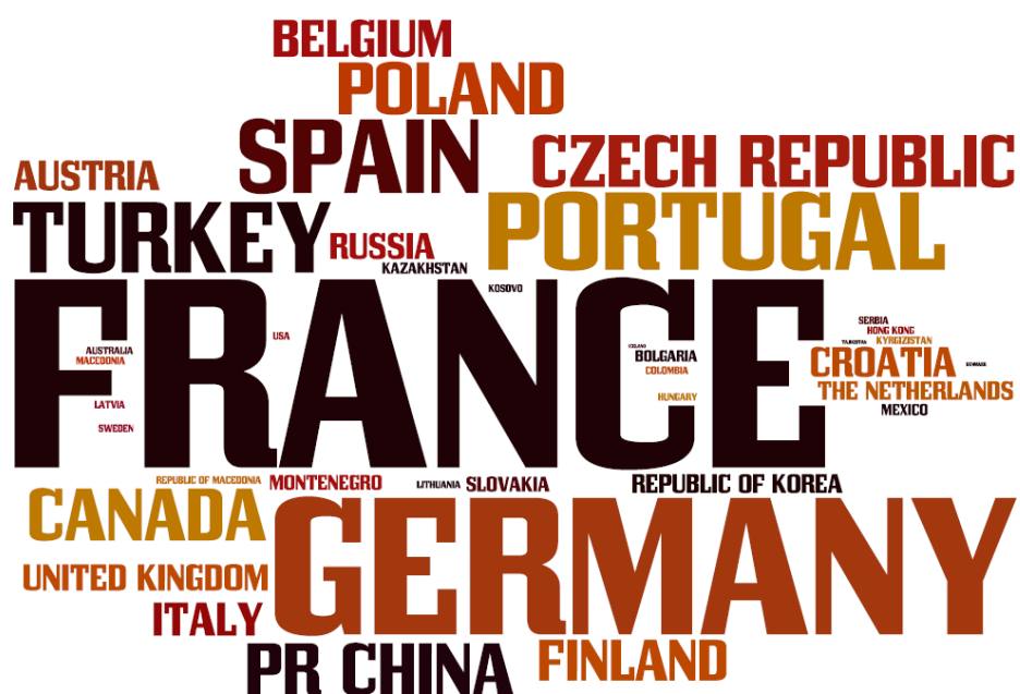
Slika 3: Najbolj pogoste države iz katerih prihajajo Erasmus študenti v š.l. 2013/14