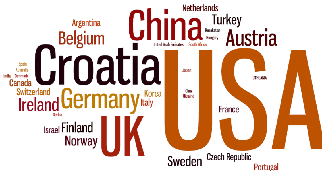
Slika 1: Države iz katerih prihajajo gostujoči pedagogi