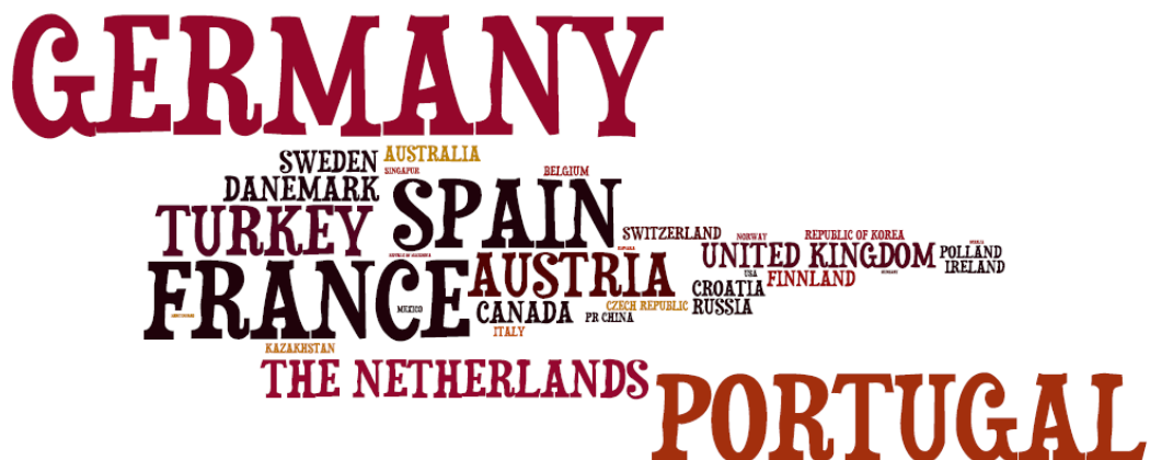
Slika 2: Najbolj pogoste države za odhajajoče študente EF UL v š.l. 2013/14